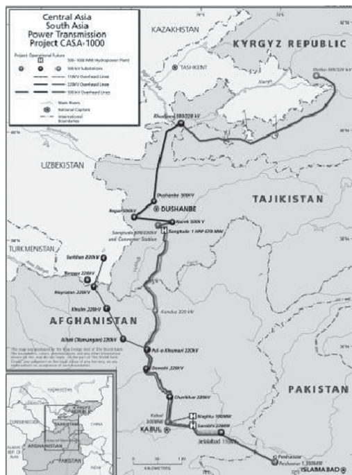
Picture 2. Southern branch of the Silk Road: map of the transnational energy corridor CASA-1000. Source: news.ivist.kz

Южное ветвление шелкового пути: карта транснационального энергетического коридора CASA-1000. Источник: news.ivist.kz 26 .