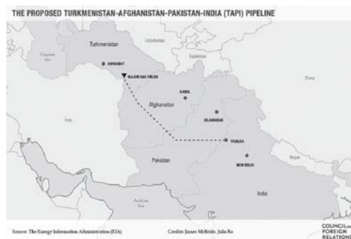
Picture 1. The Southern branch of the Silk Road: map of the transnational gas pipeline corridor "Turkmenistan-Afghanistan-Pakistan-India" (TAPI).

Южное ветвление шелкового пути: карта транснационального газопроводного коридора Туркменистан-Афганистан-Пакистан- Индия (ТАПИ). 16